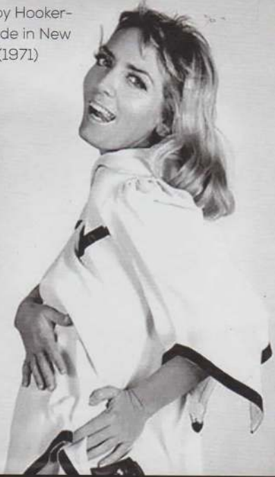
Happy Hooker- periode in New York (1971)