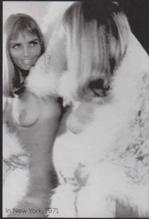
In New York, 1971