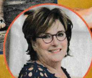
Catherine & Co.

geslacht is te groot of te klein, ik kom te snel klaar of juist helemaal niet. Dat waren de vier onderwerpen.'