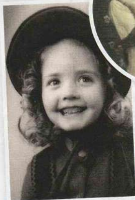
Xaviera (12) met haar vader in Amsterdam