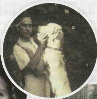
Vader Mick in Indië