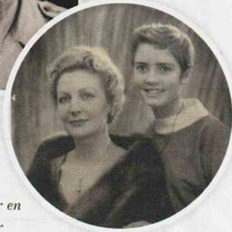
Germaine met haar tienerdochter

tijd weg uit het kamp toen ze als driejarig meisje uit een boom viel en bijna werd gespiesd door een boomstronk. "Ik heb er vlak naast mijn vagina nog een groot litteken aan overgehouden." De baboe bedacht zich geen moment en droeg haar naar het kampziekenhuis. Daar waren twee artsen aan het werk. Een van hen boog zich over haar heen. Later zou blijken dat dat haar eigen vader was. "Ik herkende hem natuurlijk niet, en hij wist niet dat ik zijn dochter was. Hij heeft me geopereerd en de wond gehecht." Een halfjaar later, toen de Bersiap voorbij was, zag hij haar weer terug. "Mijn moeder had zich speciaal opgedoft en mooi gemaakt. Mijn vader kwam het tuinpad op lopen, en had op dat